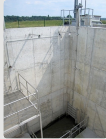
Zona de intrarea a stației de ridicare