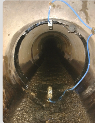
Punctul de măsurare din canal